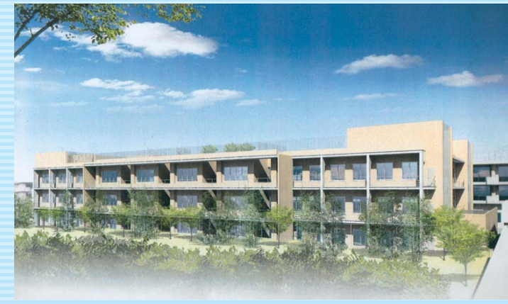
新棟完成イメージ

当院では、現在新棟の建設を進めております。これまで、設計、設備の検討を重ね、現在は運用のすり合わせやスムーズな稼働を目指し各会議で検討しております。精神科医療の進歩に対応するため必要とされるハードも大きく拡充されています。