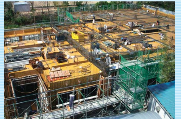
着々と進む新棟工事現場

す。また今後起こりうる既存施設の老朽化の問題を踏まえ、新棟を建設することといたしました。既存の施設と同様、3階建てまでの建物とし、より満足度の高い医療、看護を提供していきたいと考えています。 新棟には地階に薬局、中央検査室、1階からは外来や精神科救急病棟、合併症対応のできる病棟を機能させる予定です。工事も着々と進んでいます。秋には竣工のご案内をさせていただけるかと存じます。